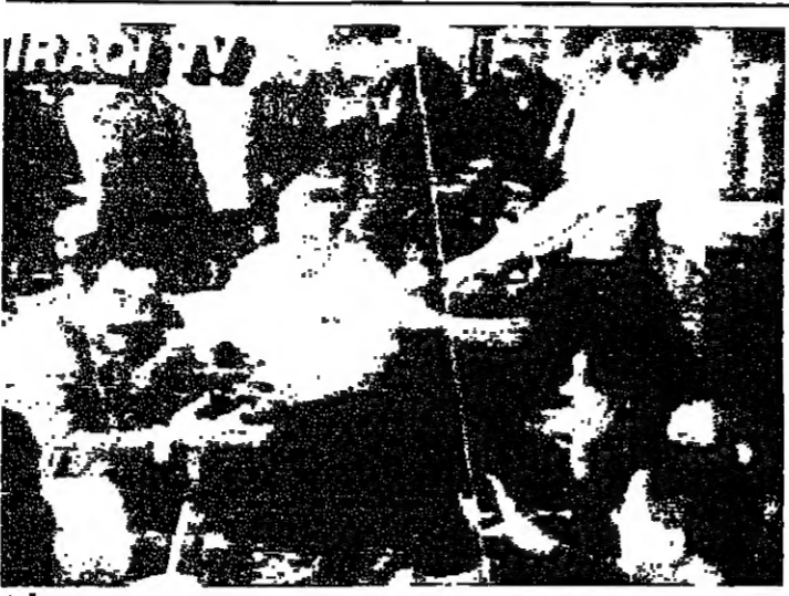
صدام يتحدث الى الصحفيين النرويجيين

بدأ الأمين العام للأمم المتحدة بيريز دي كويار يوم الخميس ١٤ أيار ١٩٩٠ في الكويت في اجتماع مع وزير الخارجية العراقي طارق عزيز للقاءه الاسبوع المقبل في نيويورك او جنيف للبحث عن حل سلمي للازمة. وصرح دي كويار خلال مؤتمر صحفي عقده في بوفوتا حيث يقوم بزيارة رسمية منذ الاربعة الايام دعوت وزير الخارجية العراقي طارق عزيز الى لقاى سريعا في نيويورك او جنيف للبدء بمشاورات كاتل لوجهات النظر حول الازمة الحالية والتي افضل ان يكون ذلك الاسبوع المقبل. واوضح الأمين العام للأمم المتحدة انه بعد صدور خمسة قرارات للأمم المتحدة حول الازمة، حان الوقت ليقوم الأمين العام بجهود دبلوماسية لتخفيف الازمة في الخليج في جميع اوجهها عبر عملية حوار. وأضاف دي كويار ان مجلس الأمن قام خلال الاسبوعين الماضيين بعمل بالغ الأهمية. وقال ان دعوة طارق عزيز تمثل مسعى دبلوماسيا ثمرته من تلقا نفسي، موضحا انه سيجعل بشكل مطبق لجميع مبادرات مجلس الأمن. وأضاف دي كويار ان مجلس الأمن لا (البقية على الصفحة ٩)